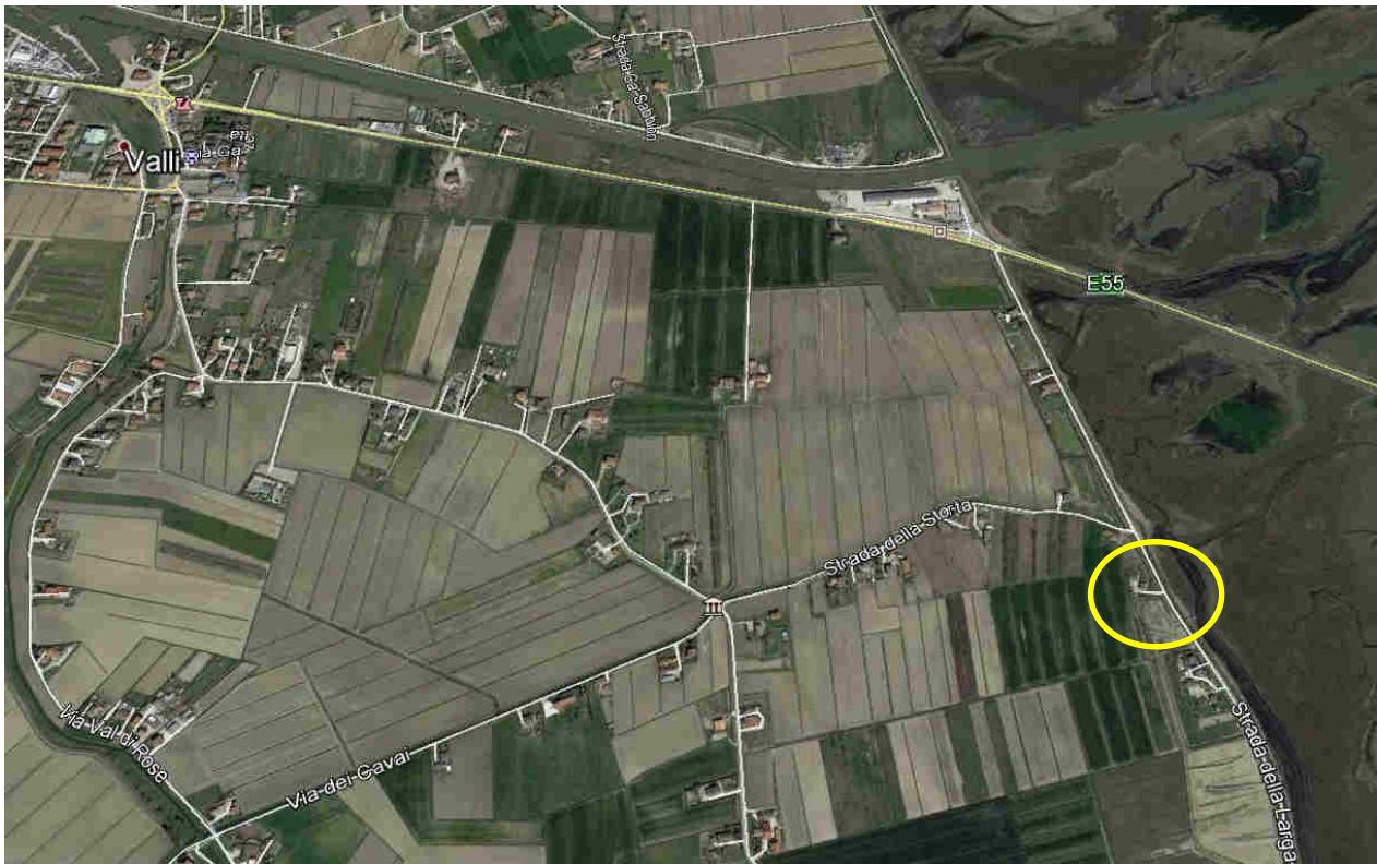
Immagine da satellite